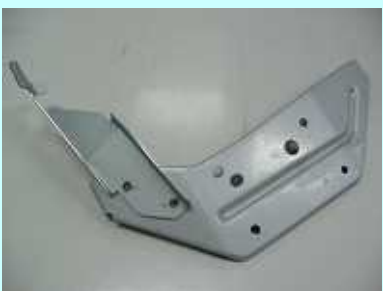
プレス加工 スポット溶接加工