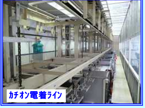
カチオン電着ライン