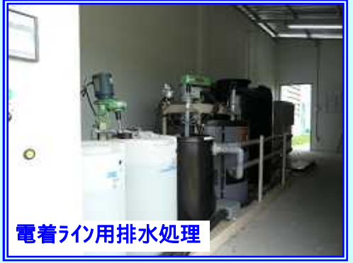
電着ライン用排水処理