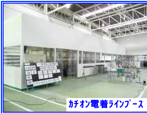
カチオン電着ラインブース