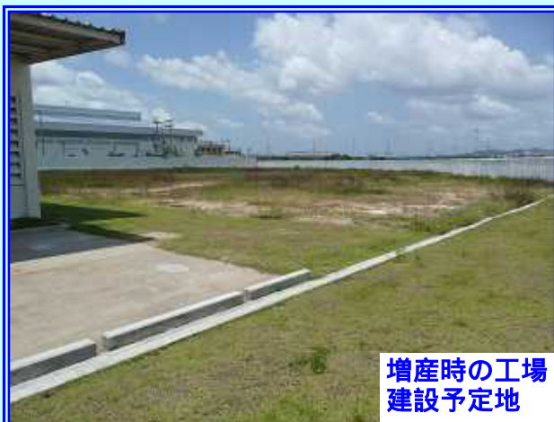
増産時の工場 建設予定地