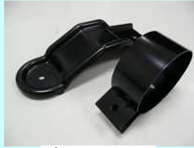
プレス加工 カチオン電着塗